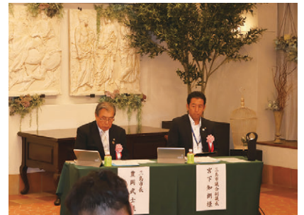
来賓の豊岡市長と宮下副議長