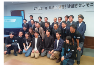
引継ぎセレモニー

10月16日（木）、三島信用金庫本店で「LtG Startup Studio 運営引継ぎセレモニー」が行われ、加和太建設から三島信用金庫へ運営が継承されました。これに合わせて、三島市、三島商工会議所、静岡銀行、加和太建設、三島信用金庫は「企業・スタートアップ支援に関する連携協定書」を締結し地域連携のもと、新たな産業、雇用の創出による地域経済の活性化を後押ししていきます。