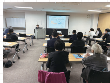
カスハラの対処方法を学ぶ参加者