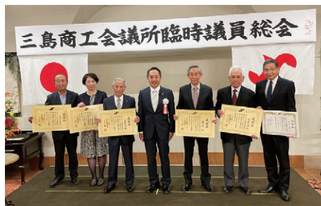
退任の皆様ありがとうございました