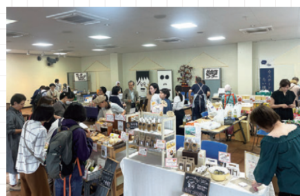
多くの来場者が楽しむ様子