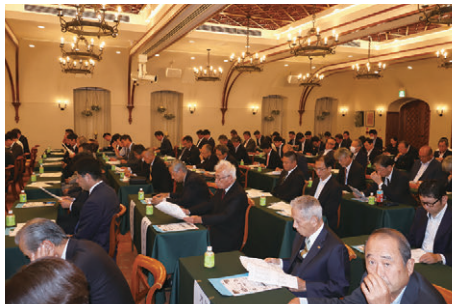
臨時議員総会のようす