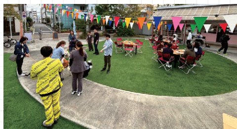
秋晴れの中、交流を深める参加者