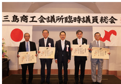
退任の皆様お世話になりました