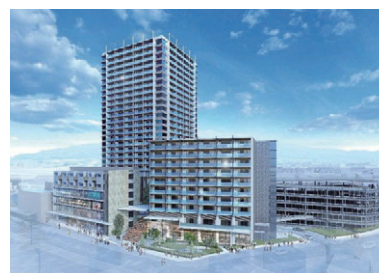
まちづくりイメージ（東街区）

今回、現在進行の主なまちづくり事業の進捗から今後想定されるヒト、モノの変化、関係するエリアの商店街・個店の対応策等についてレポートします。