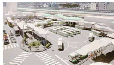
まちづくりイメージ（三島駅南口整備）